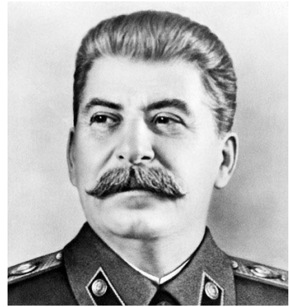
Josef Stalin (1898-1953) Josef Stalin var generalsekretær i Sovjetunionens kommunistiske parti i knap 31 år fra udnævnelsen i april 1922 til sin død i marts 1953