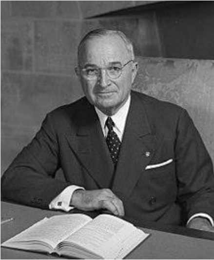
Harry S. Truman (1884-1972) Han var USA's præsident fra 1945-1953.

Den 12. marts 1947 bekendtgjorde den amerikanske præsident Harry Truman den såkaldte Truman-doktrin i en tale til USA's kongres. Sammen med Churchills tale den 5. marts 1946 kan Trumans tale også betragtes som starten på Den kolde Krig, idet doktrinen slår en antikommunistisk udenrigspolitik fast.