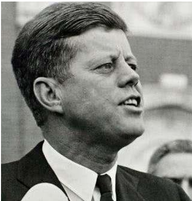
John Fitzgerald Kennedy (1917-1963) USA's præsident 1961-1963

Lav mindst 5 spørgsmål til nedenstående tekst som din sidekammerat skal svare på.